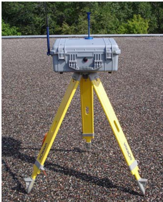
Rysunek 2: DustTrak II TSI w obudowie środowiskowej

sku, w którym później będzie wykonywany ciągły pomiar zapylenia. W przeciwnym razie o pomoc należy zwrócić się do dostawcy aparatury pomiarowej.