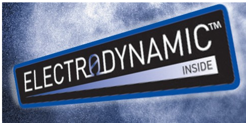
Rysunek 6: Oznaczenie zastosowanej technologii na pyłomierzach PCME

Decydując się na rozwiązanie oferowane przez francuskiego producenta trzeba wziąć pod uwagę prawidłową lokalizację aparatu. Miejscem instalacji nie może być nisza, w której nie występuje ruch powietrza lub ruch ten jest ograniczony. W wypadku dużej powierzchni, która ma być monitorowana trzeba uwzględnić pomiar w kilku punktach, w celu zapewnienia wartościowych i adekwatnych do istniejącej sytuacji wyników.