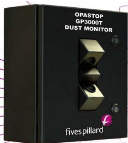
Rysunek 5: OPASTOP GP3000T Fives Pillard

Seria Leak Alert cechuje się łatwością instalacji i obsługi, prostotą konfiguracji i możliwością kalibracji w odniesieniu do pomiarów grawi-