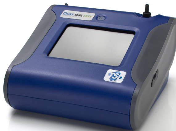
Rysunek 1: DustTrak II TSI

porównanie z pomiarem grawimetrycznym. Oba podejścia są uzasadnione, ale żadne z nich nie odnosi się bezpośrednio do pomiaru ilości unoszącej się biomasy w zadanej objętości, więc należy wziąć pod uwagę wykonanie kalibracji na obiekcie, na którym będzie później wykonywany pomiar. Jeśli dostępne są wyniki badań prowadzonych na stanowisku pracy, świadczące o wielkości zapylenia można się nimi posłużyć, pod warunkiem, że badania te zostały wykonane w środowi-