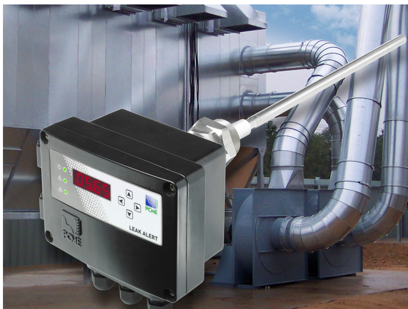
Rysunek 3: Seria Leak Alert PCME