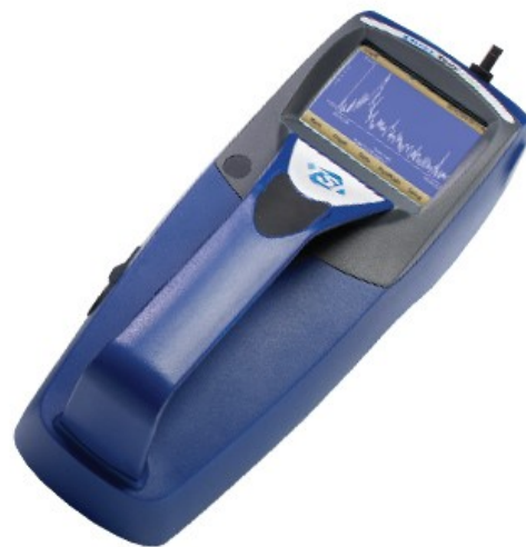
Rysunek 7: DustTrak II TSI wersja przenośna

Na rynku dostępnych jest co najmniej kilka rozwiązań do ciągłego monitoringu zapylenia na halach, gdzie głównym składnikiem pyłu zawieszonego jest biomasa. Dobór odpowiedniego rozwiązania jest krytyczny, więc z pewnością nie należy oszczędzać czasu na podjęcie odpowiedniej decyzji.